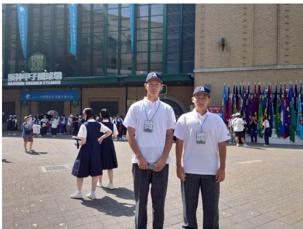
阪神甲子園球場前で