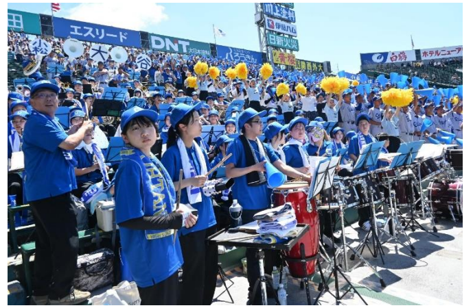
歓喜に沸く小松大谷の応援席