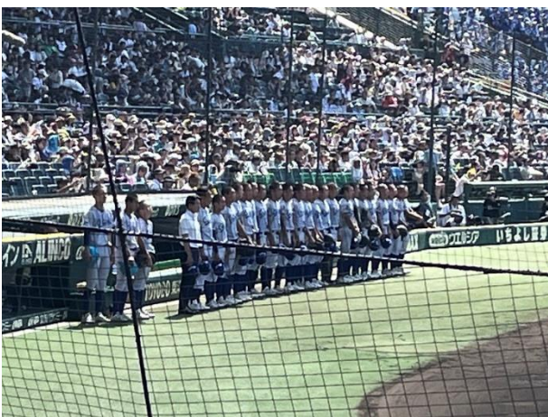
ベンチ前で整列する小松大谷の選手たち