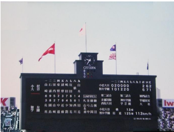
6回までのスコアボード