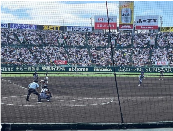
守る小松大谷の選手たち