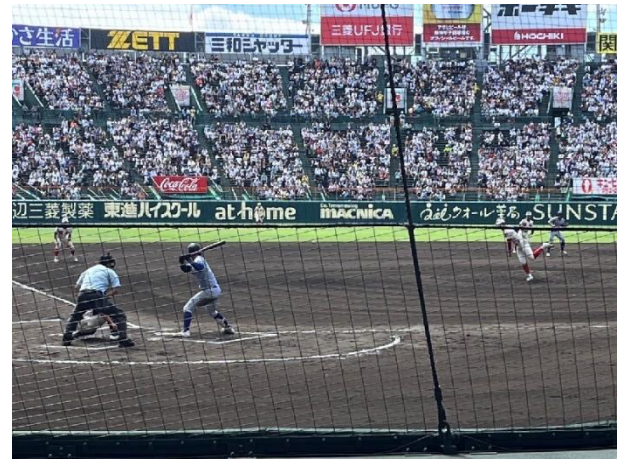
小松大谷の攻撃中