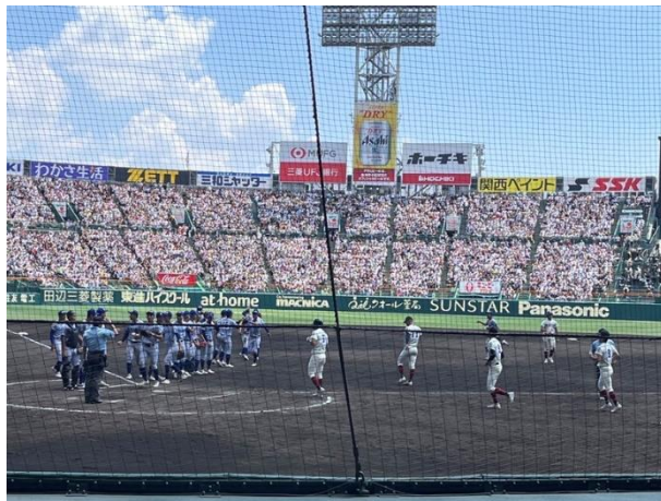
試合後、駆け寄る両チーム