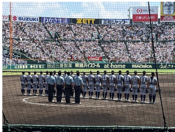
校歌を歌う小松大谷の選手たち