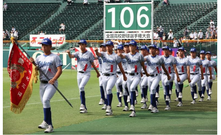
入場行進する小松大谷の選手たち