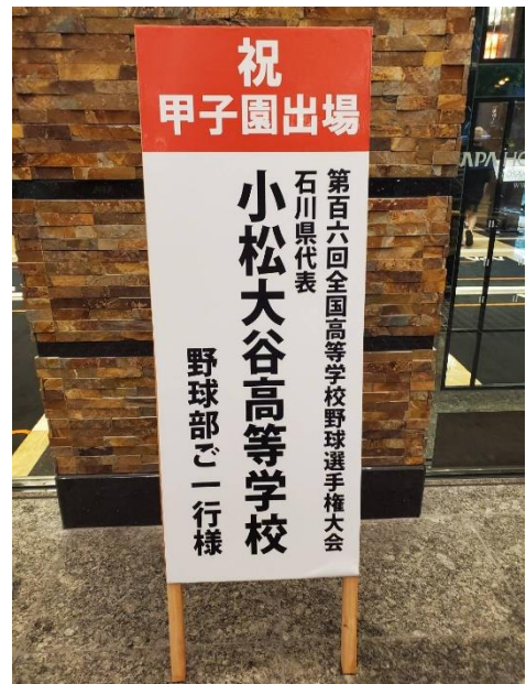
歓迎を受ける小松大谷高校野球部