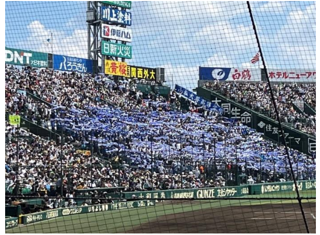
歓喜に沸く小松大谷の応援席