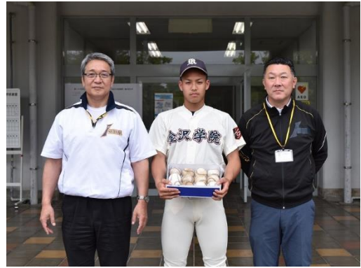
金沢学院大学附属高校