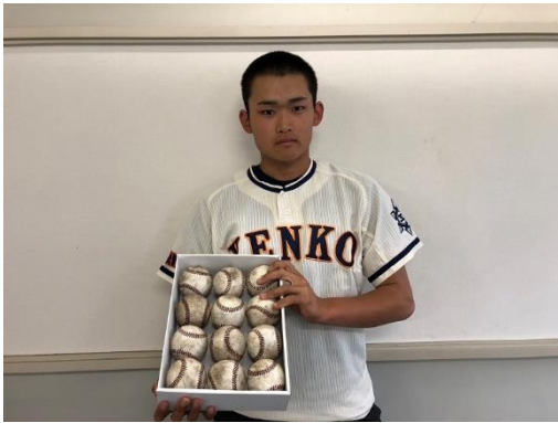
石川県立工業高校