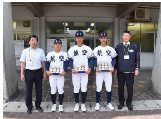
日本航空高校石川