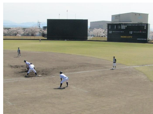
4月2日 第二試合 鶴来・松任・加賀—平安 二回裏の様子 = 寺井球場