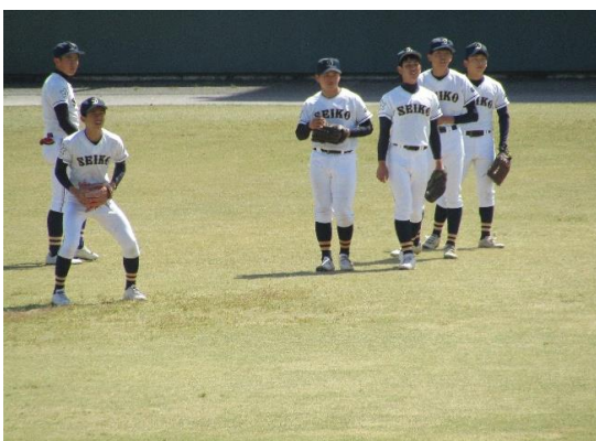
4月2日 第二試合 大聖寺—平安 試合前の大聖寺 = 弁慶