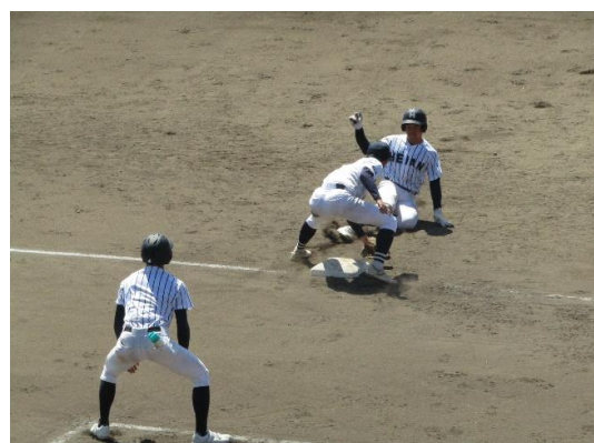
4月2日 第一試合 平安—小松工 九回表の様子 = 弁慶