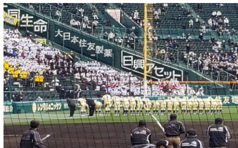
3月28日 一礼する星稜の選手たち