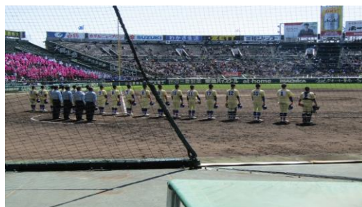
3月27日 試合終了後の星稜の選手たち