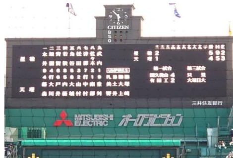
3月22日 試合終了後のスコアボード