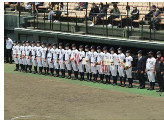
準優勝 日本航空石川