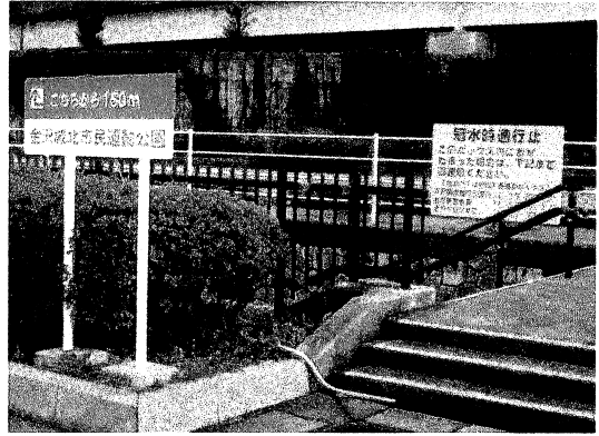
城北市民テニスコート第1駐車場内に地下道の入口があり、そちらを150mほど進むと、市民野球場へと通じています。こちらの地下道もぜひご利用ください。

点線で囲った部分は主に野球場利用者の駐車場とします。ただし、高校野球やミリオンスターズの試合や市民サッカー場等の他の施設の利用者と輻輳し、明らかに駐車場が不足する場合は⑧、⑫の駐車場の利用も含めて施設側で別途指示します。